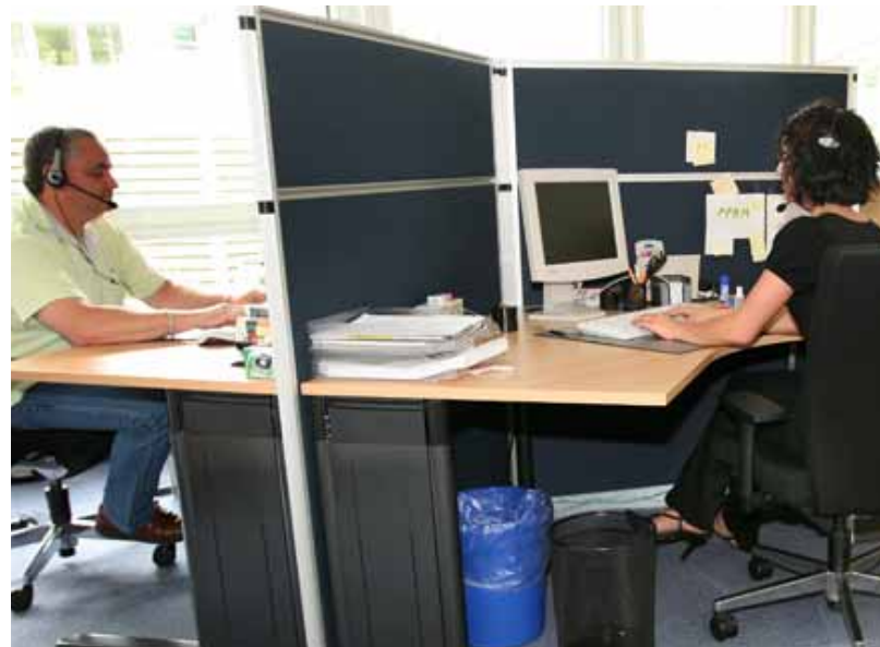
Die Mitarbeiter(innen) im Callcenter beantworten Ihre Fragen und informieren Sie rund um die Themen Bundeswertpapiere und Bundesschuldbuchkonto.

Etwas entspannter ist die Lage in den beiden Filialen der Finanzagentur. Interessierte, die sich persönlich in Frankfurt oder Berlin ein Bild von der Finanzagentur und ihrem Service-Team machen möchten, können sich dort ebenso kompetent und individuell informieren lassen.